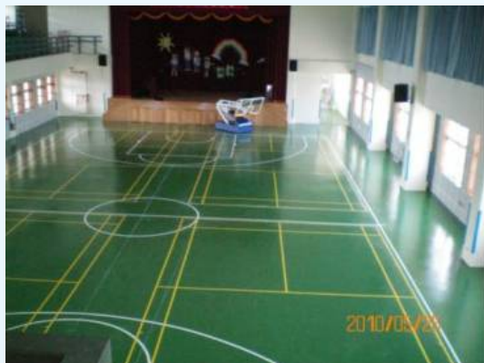
多功能的活動中心