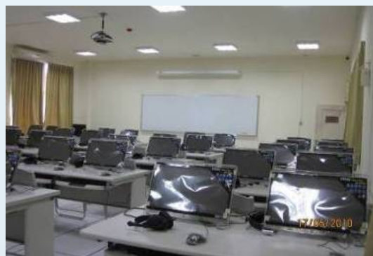
數位化的多媒體教室