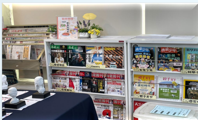
(中壢書院-報章雜誌區)