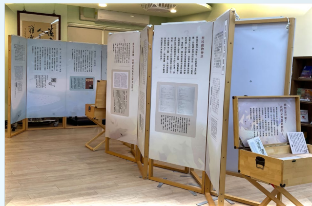
(中壢書院-專題展示區)