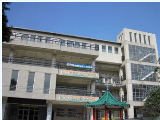
新穎的行政教學大樓