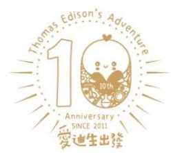
附件六：「『愛』迪生出發」科教館公益學習活動機關支出分攤表